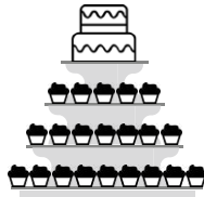
Etagere mit Torte und Cupcakes