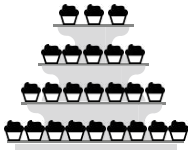
Etagere mit Cupcakes

Unsere Etagere gibt es in unterschiedlichen Ausführungen. Hier werden die verschiedenen süßen Köstlichkeiten (Torte, Cake-Pops, Cupcakes) in der gewünschten Anzahl kombiniert.